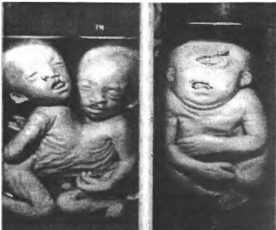
3 paveikslas. Būsimieji gimdytojai, ar norite kad jums taip atsitiktų?

Geriančios ir rūkančios motinos ir jų suaugusios dukros dažniau pagimdo neišnešiotus kūdikius. Taip pat jų naujagimiai dažniau serga cerebraliu paralyžiumi, išsėtine skleroze. Šių ligų šiuolaikinė medicina išgydyti nepajėgia.